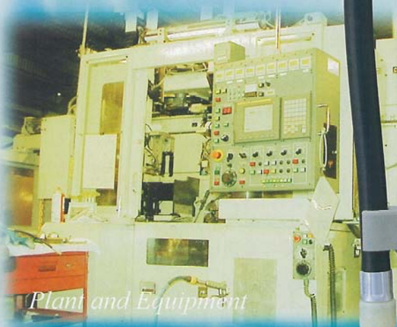
Plant and Equipment